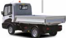
Pritschenwagen mit Seitenwänden