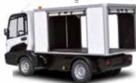
Kastenwagen mit Jalousie