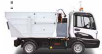
Müllkipper & 200 l Hochdruckreiner