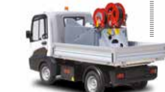
200 l Hochdruckreiner